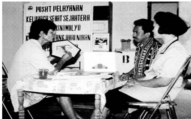
Bidan Mandiri yang diberdayakan untuk memberikan motivasi KB dan Kesehatan Reproduksi

PENINGKATAN MUTU BIDAN MANDIRI DAN TENAGA PARAMEDIS TERLATIH