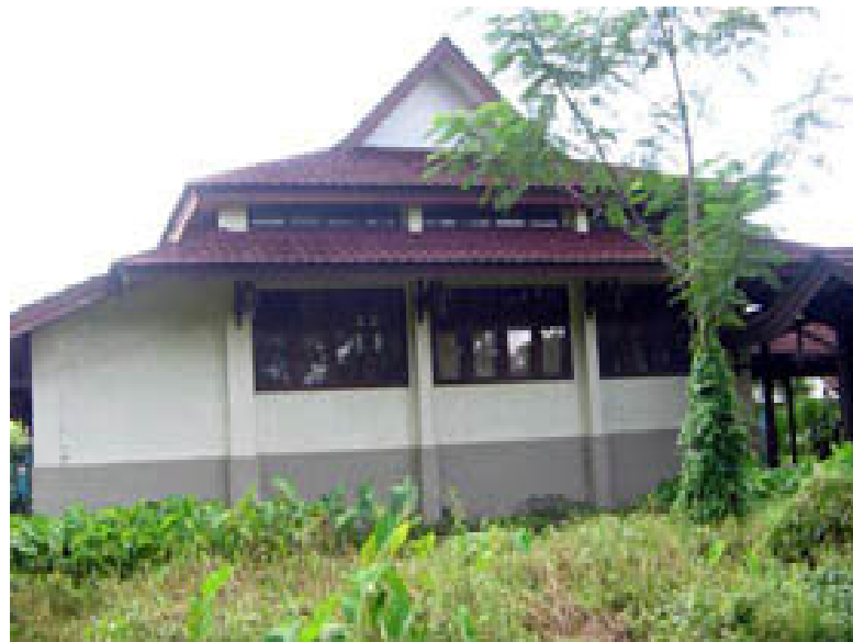
Gambar Laboratorium Hama Dan Penyakit Fakultas Pertanian UNTAN Sebagai Tempat Penelitian