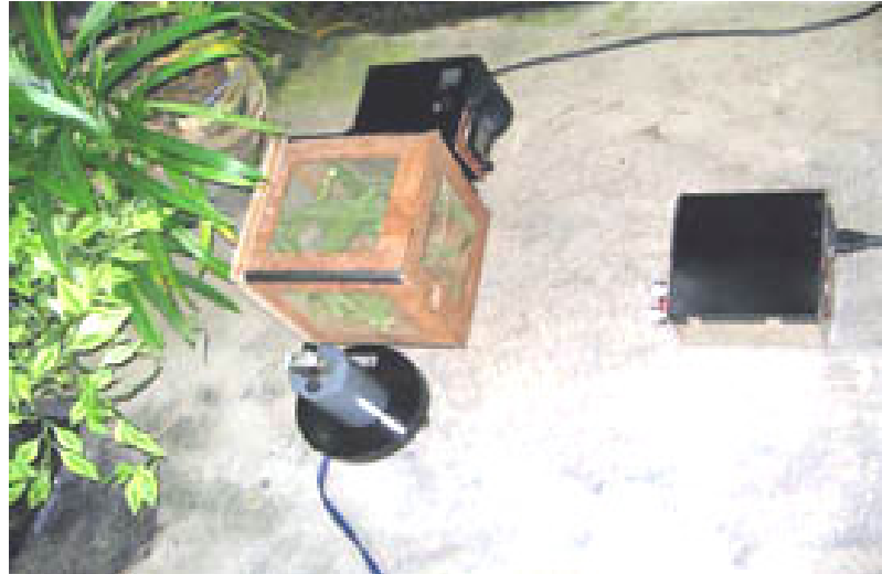
Kotak Sampel Belalang Kembara, Kamera, Transduser Penerima Gelombang Ultrasonik Dan Alat Pembangkit Gelombang Ultrasonik serta Faktor Penghambat/Tanaman