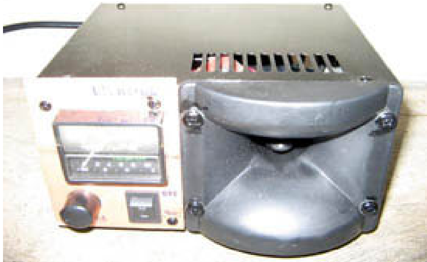
Gambar Alat Transduser Penerima Gelombang Ultrasonik