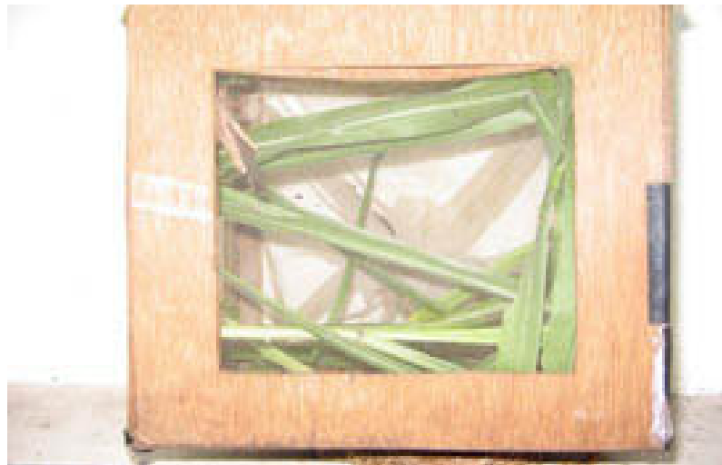
Kotak Sampel Belalang Kembara, Kamera Dan Transduser Penerima Gelombang Ultrasonik Serta Faktor Penghambat/Tanaman