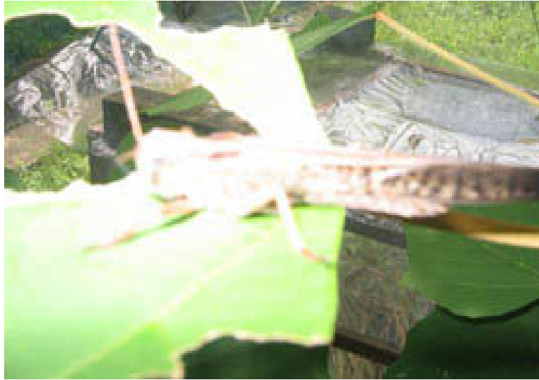
Kotak Sampel Belalang Kembara