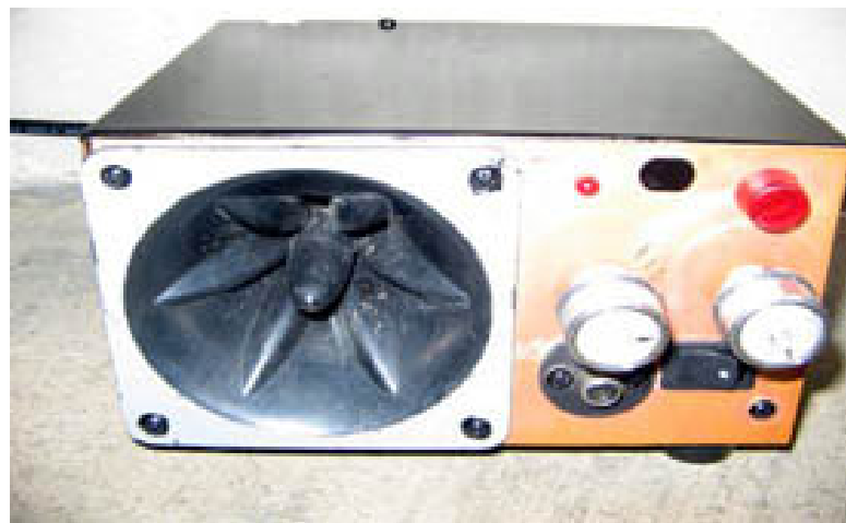
Gambar Alat Pembangkit Frekuensi Gelombang Ultrasonik